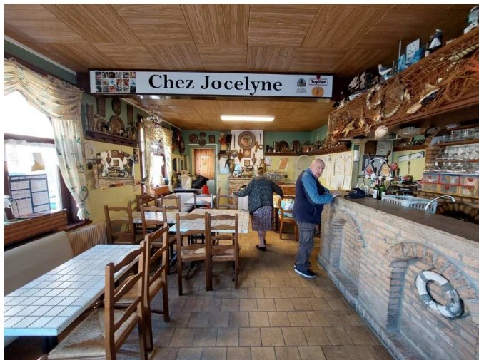
W. Sohier (Portretten uit het Noorden)